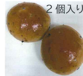
← 「発芽玄米と黒米の 食卓ロール」 150円 238kcal