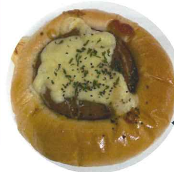
← 「チーズハンバーグパン」 185円 250kcal