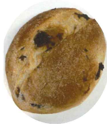
↑「レーズンブレッド」 194円 386kcal