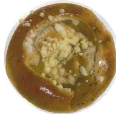
「りんごとチーズの クランブルパン」 → 173円 264kcal