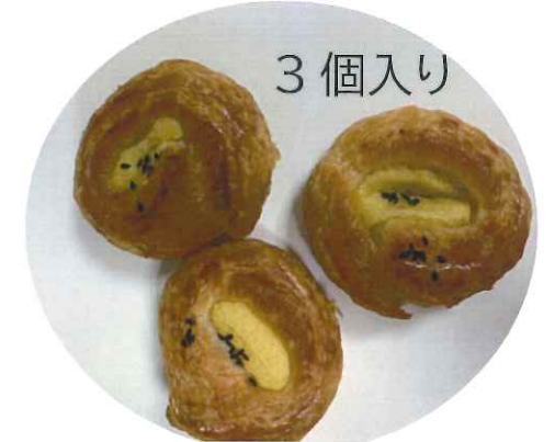
↑「ミニおさつ デニッシュ」 210円 291kcal