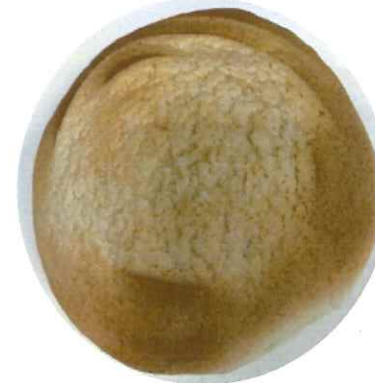
↑「塩バター クッキーパン」 173円 344kcal