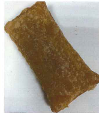
← 「フライドさつま芋 カスタードパイ」 165円 265kcal