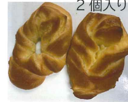
← 「十勝バターの ミニパン」 140円 166kcal