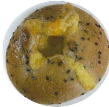
← 「セサミチーズフランス」