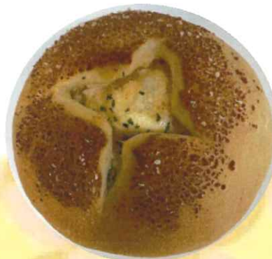
↓「明太ポテトパン」 120円 204kcal