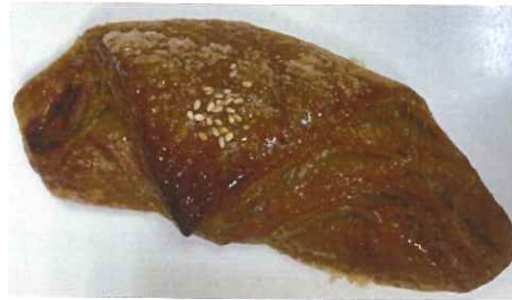
← 「栗クリーム&餡クロワッサン」